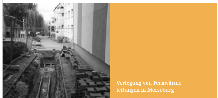
Verlegung von Fernwärmeleitungen in Merseburg

Im Berichtsjahr 2005 konnten einige Neukunden für die Fernwärmeversorgung akquiriert werden, z. B. das Altenpflegeheim in der Dammstraße und das Domstadt-Kino Merseburg. Ebenfalls wurden noch einige Wohngebäude der WG Kohle Geiseltal in Merseburg West an das Fernwärmenetz angeschlossen. Gerade vor dem Hintergrund des derzeitigen Stadtumbaus sind diese Neuanschlüsse für die weitere Absatzentwicklung dieser Sparte sehr bedeutsam.