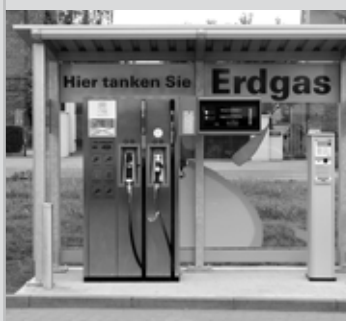
Erdgastankstelle auf dem Gelände der STAR-Tankstelle in Merseburg

Wir gehen davon aus, dass trotz des anhaltend negativen Trends im wirtschaftlichen Umfeld unseres Unternehmens der Gasabsatz leicht steigen wird. Dazu werden u. a. das neue BHKW-Modul der Gesellschafterin Stadtwerke Merseburg GmbH und die Ansiedlung weiterer Industriekunden beitragen.