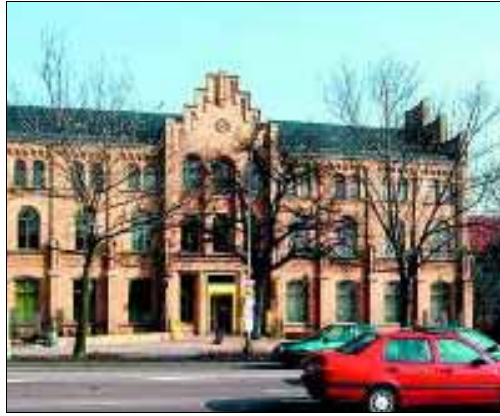
Zwischen Eulenturm und Bahnhof gibt's viel zu entdecken: die Norbertkirche mit ihren sakralen Schätzen, die König-Heinrich-Statue, aber auch das historische Postgebäude und das riesige Wandbild aus den 80-ern.