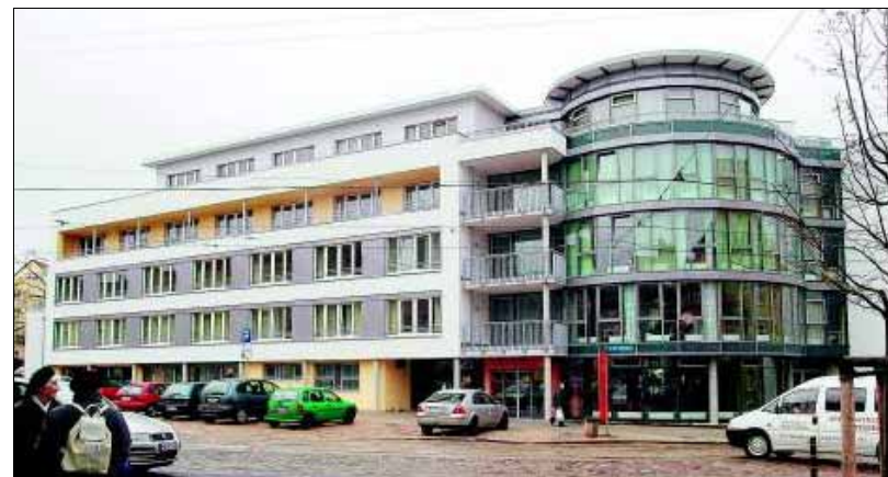
Mitten in der Innenstadt gelegen: das im Herbst 2005 eröffnete Kursana Domizil Merseburg, An der Hoffische- rei 2.

Aus dem Gemeinschaftsraum im Erdgeschoss dringt schwingvolle Musik. Und tatsächlich, dort wird geschunkelt, was das Zeug hält. Eine junge Therapeutin zeigt den Bewohnerinnen im Rollstuhl, dass man sich auch im Sitzen hervorragend nach Musik bewegen kann. Zwei Pflegerinnen haben sich in den fröhlichen