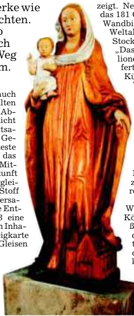
Diese hübsche Marienfigur mit Jesuskind steht in der Sankt-Norbert-Kirche.

Wir überqueren die König-Heinrich-Straße und stehen vor dem 1875 errichteten Postgebäude, dessen gelben Klinkersteinen der blaue Himmel hervorragt. Erst kürzlich saniert, präsentiert sich der vornehme Bau mit seinem typischen Telegrafenturm