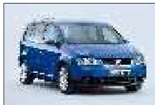
Auch zu testen: der VW Touran mit Erdgas.