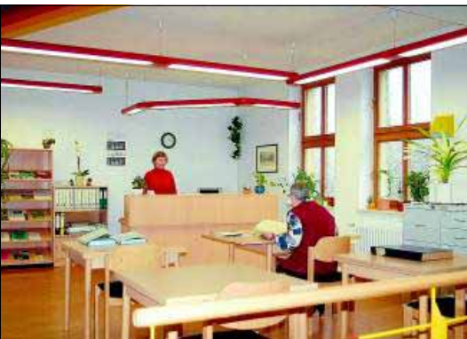
Im Lesesaal des Stadtarchivs war früher die Kinderbibliothek untergebracht.