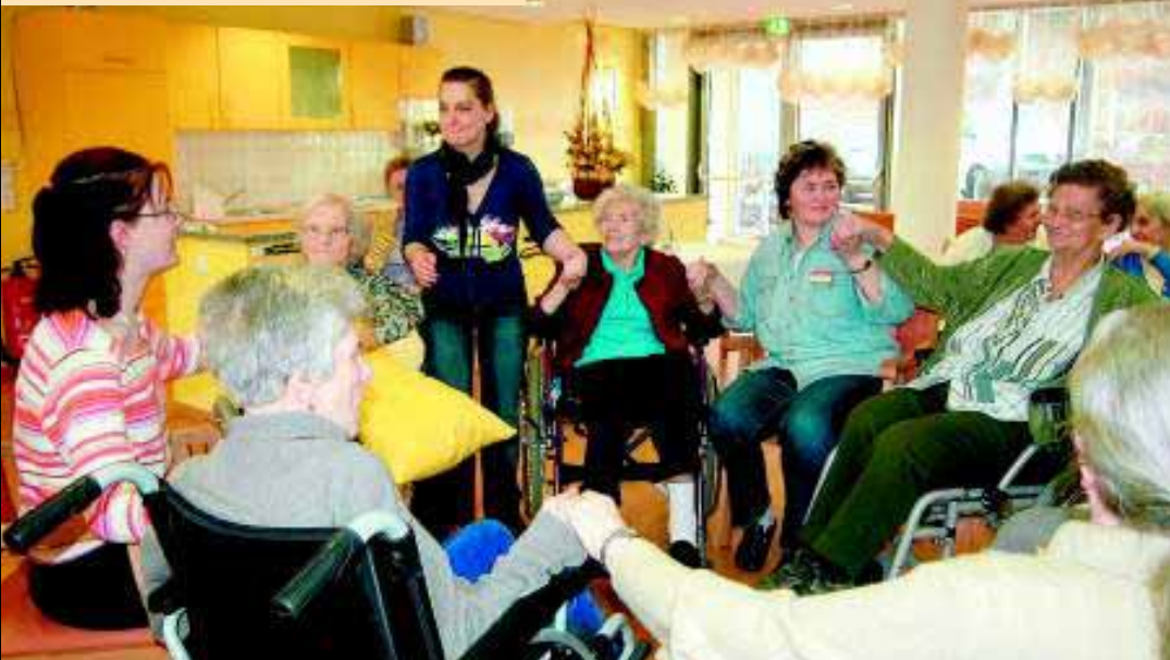
Bewegung nach Musik tut Körper und Seele gut – um so mehr, wenn man es gemeinsam tut.