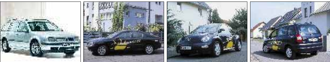
Die Erdgas-Testfahrzeuge sind VW Golf BI FUEL, Volvo S 60, VW Beetle, Opel Zafira (und siehe unten rechts: der VW Touran)