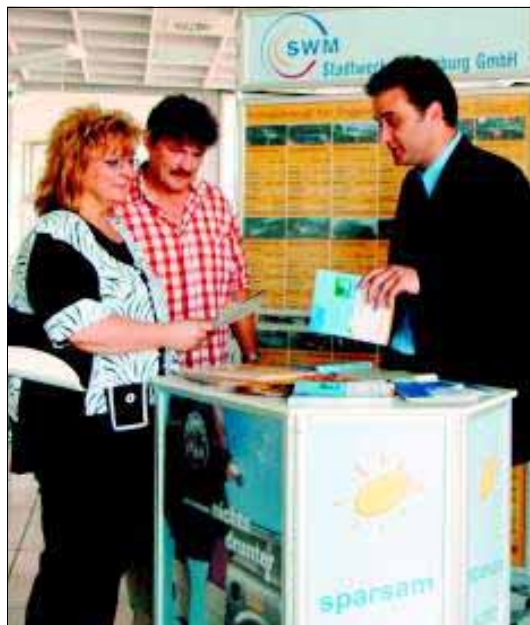
Immer mehr Kraftfahrer interessieren sich für Erdgas-Autos. Die Mitarbeiter der Stadtwerke sind deshalb überall gefragte Gesprächspartner.

Ganz gleich, ob es um die jüngere Geschichte unserer Stadt geht oder um Ereignisse, die schon vor Jahrhunderten hier stattfanden: Die Türen des Historischen Stadtarchivs stehen jedem, der ernstzunehmende Gründe für seine Recherchewünsche hat, offen. Unsere Mitarbeiter haben