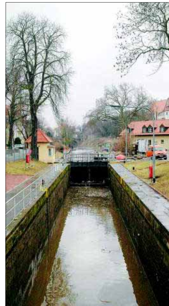
49,51 Meter lang und sechs Meter breit ist die Meuschauer Schleuse, die als „Schiffsfahrstuhl“ Wasserfahrzeugen hilft, Höhenunterschiede der Saale zu überwinden. Gleich daneben liegt die Merseburger Außenstelle des Wasser- und Schiffsamtes Magdeburg.