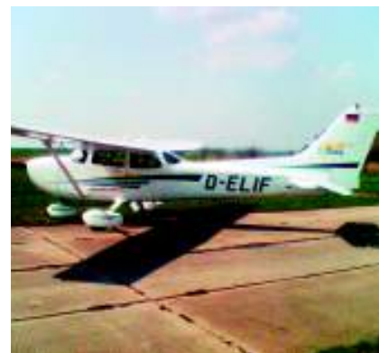
Der Skye-Van (großes Bild oben) ist auf dem Flugplatz der Domstadt ebenso zu Hause wie zahlreiche kleinere Sportmaschinen.

Neben dem Luftsportverein haben sich auf dem Flugplatz drei weitere Vereine angesiedelt: der Flugsportverein „Rudolf Oeltzschner“ Merseburg e.V., der Fallschirmsportverein FSV