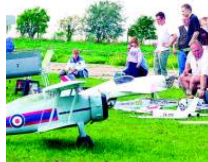
Neben dem Luftsportverein haben auch Vereine für Fallschirmsport, Modellflug und Motorsegeln ein Zuhause auf dem Merseburger Flugplatz gefunden.

Wer daran interessiert ist, sein Haus, seine Firma, seinen Heimatort einmal selber aus der Vogelperspektive zu betrachten, kann sich beim Luftsportverein Merseburg e. V. nach einem geeigneten Rundflug erkundigen. Unter der Telefonnummer 03461/ 72 33 26 gibt der Luftsportverein Informationen zu Routen, Preisen und Terminen. Infos auch unter www.flugplatz-merseburg.de im Internet.