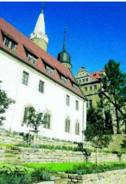
Der Domkapitelgarten verwöhnt seine Besucher vom zeitigen Frühjahr bis zum späten Herbst mit duftenden Blüten. Pavillon und Steinbank laden zum Verweilen ein.

Anordnung Herzog Christians I. (1615–1691) ab 1660 der Vorläufer des heutigen Schlossgartens. Einen schönen Lustgarten mit Hecken, Laubengängen, Taxusbäumen, Wasserspielen sowie einer Reitbahn „auf einem gut Theil vom Königshof“ hatte sich der Landesherr gewünscht. Im Jahre 1720 ließ sein Enkel Moritz Wilhelm die östliche Kastanienallee schaffen. Der älteste Plan von 1725 zeigt die typisch barocke Gestaltung in der konsequenten Achsenstruktur.