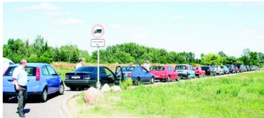
Eine lange Auto-Warteschlange zeigte die große Resonanz, die auch die zweite Aktion „Tanken zu Erdgaspreisen“ im Juli bei den Merseburgern erzielte.

Wer auf ein Erdgasmobil umsteigen möchte, kann weiterhin mit der Hilfe der Stadtwerke Merseburg rechnen. Noch 15 Erdgas-Neufahrzeuge werden mit Tankgutscheinen im Wert von 600 Euro gefördert.