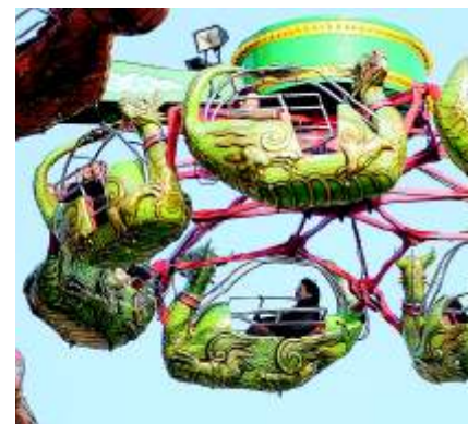
Der Wasserspielplatz Aqua Plantscha (Foto oben) bietet allen ein nasses Vergnügen. Etwas turbulenter geht es beim Mega-Drachenflug zu, weitaus ruhiger dagegen im Schlosscafé (links).

Insgesamt wurden 2006 knapp 1,3 Millionen Euro in neue Attraktionen investiert. Und der Freizeitpark wächst weiter. Sieben Themenwelten, die mit immer neuen Ideen und Angeboten für jede Menge Erlebnisse, Erholung, Spannung und Fahrspaß für die ganze Familie sorgen. Also, raus aus dem Alltag und rein in den Urlaub!