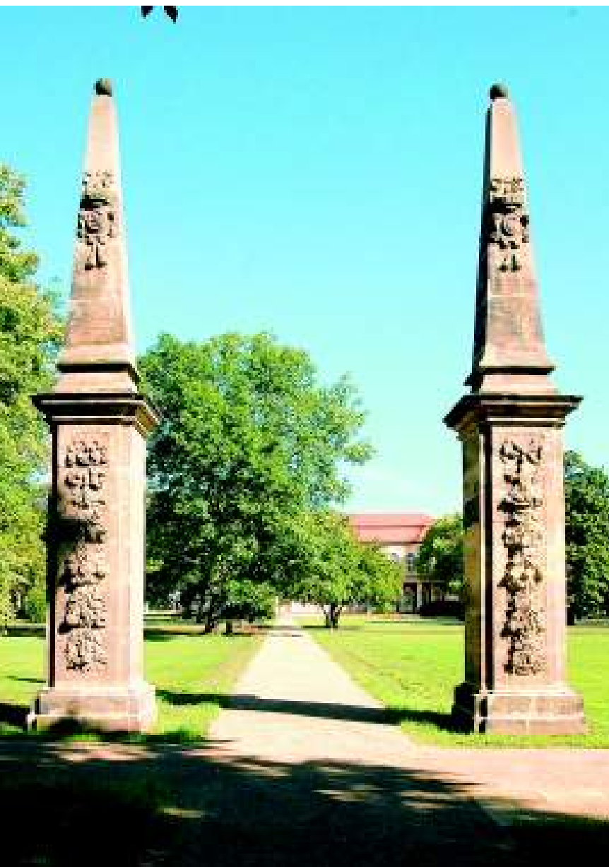
Ein Blick durch die beiden Obelisken des ersten Herzogpaares auf den Schlossgartensalon verdeutlicht das strenge Symmetrieprinzip der barocken Anlage des Merseburger Schlossgartens.