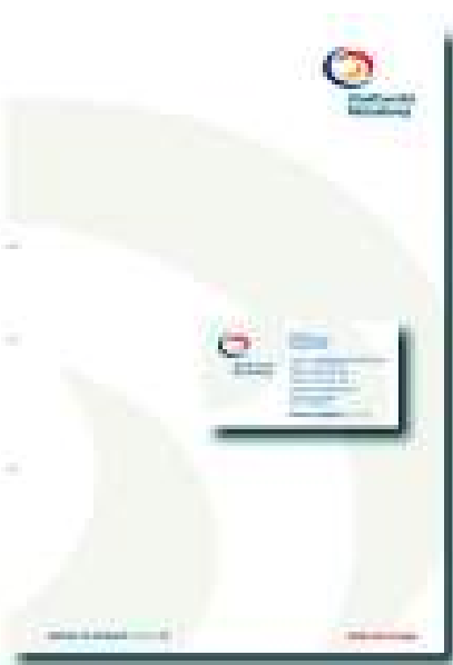
Die neue Gestaltungslinie zeichnet sich in allen Bereichen der Kommunikation durch eine hohe Wiedererkennung aus.

Zur Entwicklung des neuen Corporate Design gehört aber nicht nur die Logogestaltung. Auch ein neuer Bild-Textaufbau, Farbfestlegungen und ein neues Schriftbild zählen dazu. Für eine hohe Wiedererkennung umfasst die neue Gestaltungslinie alle Bereiche der Kommunikation: Von Briefbogen, Preisblättern und Formularen über Anzeigen und Broschüren bis hin zur Überarbeitung des Kundenmagazins. Mit der Überarbeitung des Erscheinungsbildes wird die vorhandene Kunden- und Serviceorientierung der Stadtwerke Merseburg für Kunden