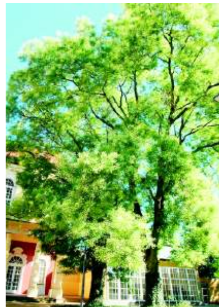
Der Rosengarten am Hinteren Gotthardteich (links) ist zu allen Jahreszeiten ein beliebtes Ziel von Spaziergängern und Erholungssuchenden. Die beiden japanischen Schnurbäume (kleines Bild) neben dem Schlossgartensalon gelten als botanische Attraktion.

Weitere und ausführliche Informationen, Reisetipps, kostenfreie Broschüren und den vom Verein Gartenträume – Historische Parks in Sachsen-Anhalt e.V. herausgegebenen Gartenträume-Veranstaltungskalender gibt es bei der Landesmarketing Sachsen-Anhalt GmbH, Info-Telefon 0180/ 5 37 2000 (zwölf Cent pro Minute) oder unter www.sachsen-anhalt-tourismus.de oder www.gartentraume-sachsen-anhalt.de im Internet.