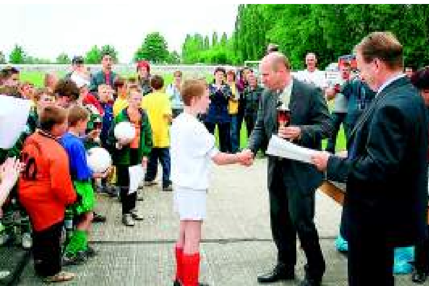
Stolz nahmen die Sieger im Vorrunden-ausscheid des Energy-M-Cups, die Mannschaft der Grundschule Merseburg West, die Preise und Glückwünsche von der Geschäftsleitung entgegen.

West qualifizierte sich mit einem Eins-zu-Null im Endspiel. Beim Finalaus-scheid in Weißenfels konnten die Mer-seburger Sieger leider nur den zehnten Platz belegen. Zehn Teams nahmen an dem entscheidenden Turnier teil. Der begehrte Wanderpokal ging an eine Grundschule in Nebra. Die nächs-te Chance auf den Pokal gibt es beim ENERGY-M-Cup 2007.