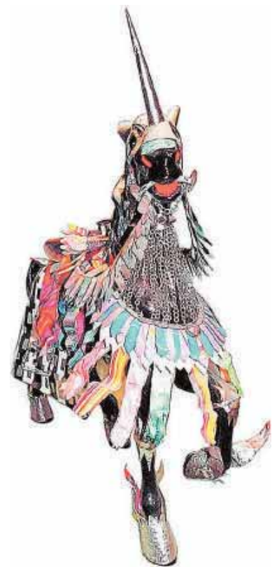
Das prächtige Ramm-Ross „Silver“ symbolisiert den sagenhaften Beginn des Silbererzbergbaus am Rammelsberg. Links: Der letzte Förderwagen, von Christo verpackt.