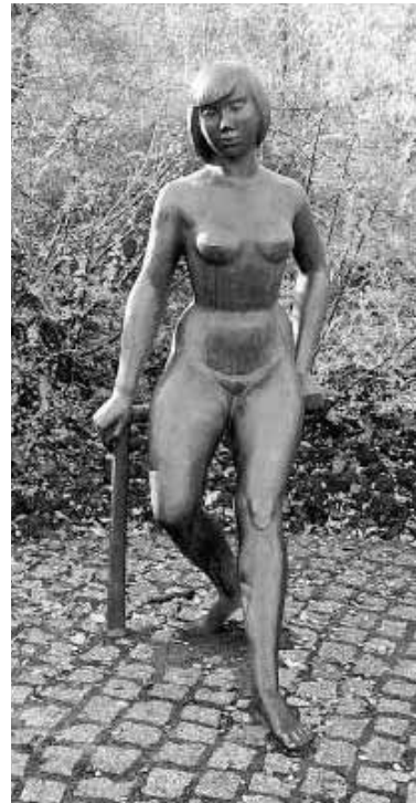
Die Bronzeplastik „Kleine Nackte“, seit 1965 Merseburgerin, zog vor einigen Jahren von der „Völkerfreundschaft“ in Merseburg-West um in den Rosengarten am Hinteren Gotthardsteich.

Aber so oft wir auch zählen, ist das Ergebnis immer nur sechs – bis man uns verrät, dass sich der siebte auf der Deckplatte versteckt. Neben „Europa-