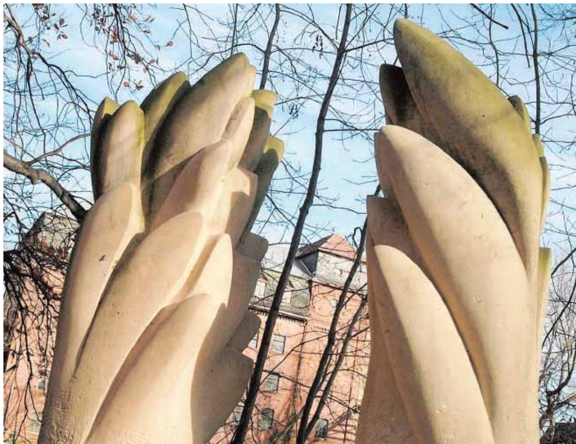
Lotosblüten an der Saale? Der indische Bildhauer Madan Lal hat sie aus zwei Meter hohem Sandstein wachsen lassen. Wie eine Vision erscheint hinter der Skulptur die alte Getreidemühle, die in naher Zukunft zu einer weiteren Merseburger Adresse für Kultur und Freizeit verwandelt werden soll. Vis-à-vis steht die vielbrüstige „Venus von Merseburg“ (unten), eine Arbeit des in Halle lebenden Künstlers Jan Thomas.