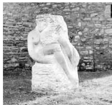
Ebenfalls aus Bronze ist der „Lesende“, der am Vorderen Gotthardsteich unter alten Weiden schmökert. Die „Erdmutter“, eine 2004 von Steffen Ahrens geschaffene Sandsteinskulptur, steht neben dem Krümmen Tor.