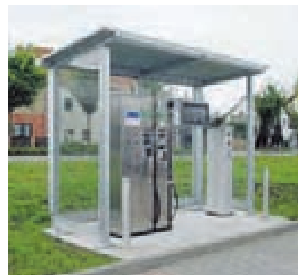
Seit Eröffnung der Erdgastankstelle in Meuschau (neben der Star-Tankstelle) im Juni 2005 entscheiden sich immer mehr Kraftfahrer im Merseburger Raum für die preiswerte Kraftstoffalternative.

Auch in diesem Jahr fördern die Stadtwerke Merseburg das Fahren mit dem umweltfreundlichen Billigkraftstoff. Für 25 neu zugelassene Erdgasfahrzeuge stellt der Energieversorger Tankguthaben von je 600 Euro zur Verfügung. Mehr Infos dazu gibt es unter Telefon 03461/ 454 230 bis -233.