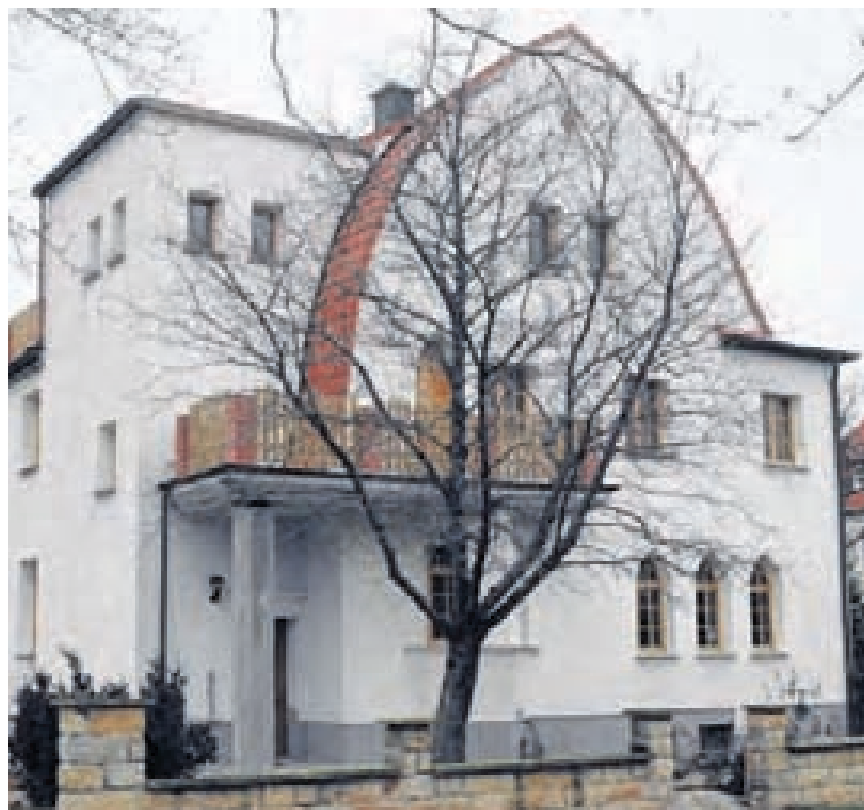
Zu den schönsten erhaltenen Zollingerbauten in Merseburg gehört dieses stilvoll sanierte Haus in der Rheinstraße.