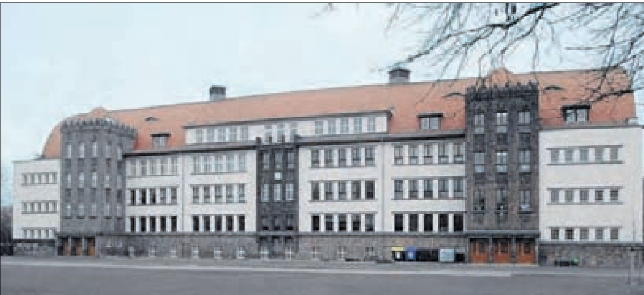
Die Albrecht-Dürer-Schule wurde in den Jahren 1927/28 gebaut und erregte damals als „modernste Schule Europas“ internationale Aufmerksamkeit.