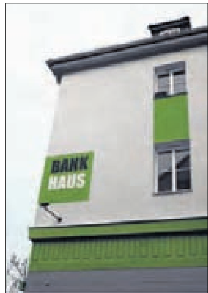
Nach langem Leerstand nimmt das sanierte Bankhaus in der König-Heinrich-Straße mit frischem Outfit und neuem Innenleben wieder am städtischen Leben teil.