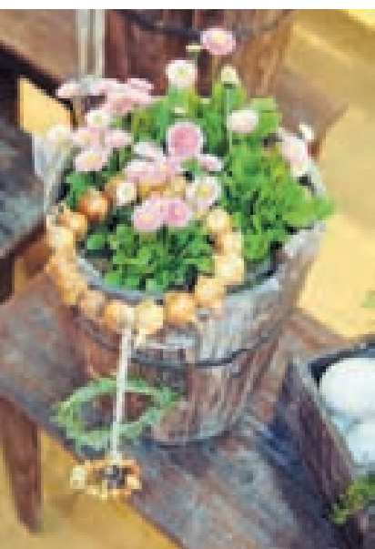
So zum Beispiel sieht trendige Osterfloristik aus: Gänseblümchen in ländlichem Ambiente, arrangiert mit Zwiebel- und Kräuterkränzen sowie einer Kiste mit ungefärbten Hühnereiern.

So gingen die beiden Fachleute in ihrer Liveshow auch auf die Rolle von Sinnbildern und traditionellen Bräu-