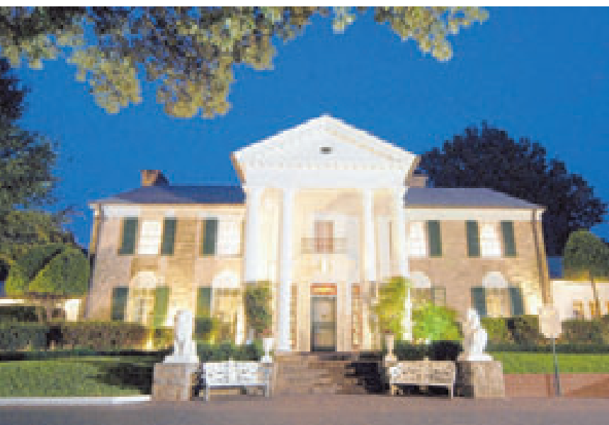
Die Villa Graceland in Memphis, Tennessee, die Elvis Presley bereits 1957 erwarb, ist heute ein viel besuchtes, aber streng bewachtes Touristenziel.