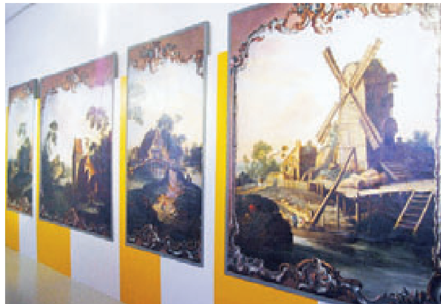
Diese prächtige Wandbespannung mit Hollandmotiven stammt aus einem Gebäude der Unteraltenburg. Sie wurde in der zweiten Hälfte des 18. Jahrhunderts von einem unbekanntem Künstler geschaffen.

Wer das Kulturhistorische Museum Schloss Merseburg besucht, sollte natürlich nicht versäumen, auch die ständige Ausstellung im Ostflügel sowie in den historischen Räumlichkeiten des Nordflügels und den spätmittelalterlichen Kellergewölben wieder einmal zu besuchen. Die Daueraus-