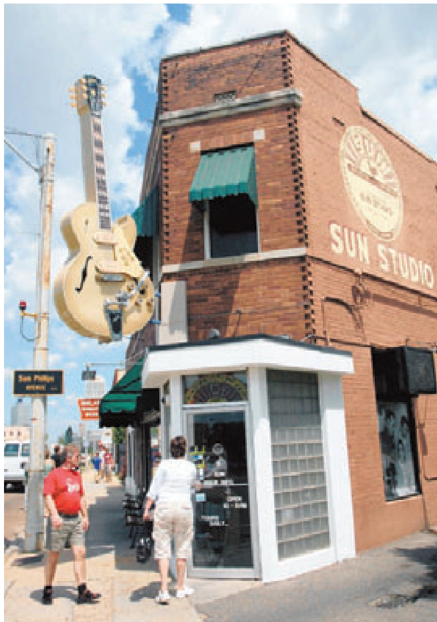
Die sagenumwobenen Sun-Studios in Memphis, Tennessee, wo die spektakuläre Weltkarriere von Elvis Aaron Presley mit einem Geburtstagsständchen für Mama ihren Anfang nahm.