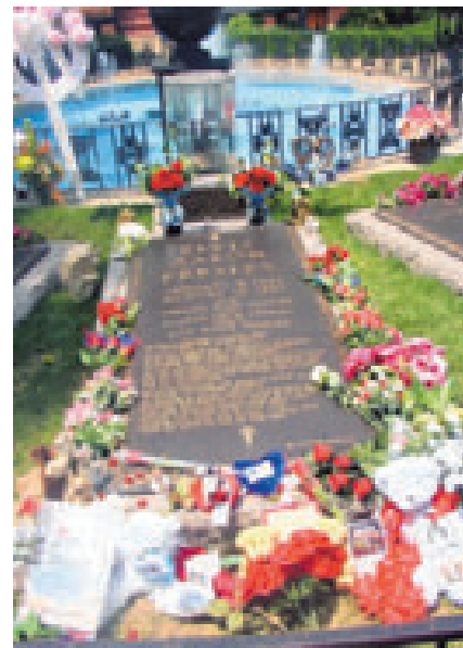
Elvis' Grab, von seinen unzähligen Fans aus aller Welt stets liebevoll mit Blumen, Kerzen und Andenken geschmückt, gilt als eine der Hauptkultstätten für den King of Rock 'n' Roll.

Seit 1982 sind mehr als 15 Millionen Menschen in Graceland gewesen. In diesem Jubiläumsjahr, vor allem in der Elvis-Woche vom 11. bis 19. August, kamen und kommen auch weiterhin mit Sicherheit Unzählige dazu. Auch das Finale des „Ultimate Elvis Tribute Artist Contest“, des größten Elvis-Wettbewerbs mit den Kandidaten von England bis Neuseeland, wird in Memphis stattfinden. Und so werden alle an seinem Grab stehen und diesen großen Moment in ihr Herz schreiben und viele kleine Geschenke hinterlassen, die diesen Ort so bunt und lebendig machen. Weitere Informationen und Reiseempfehlungen unter www.tennessee.de im Internet.