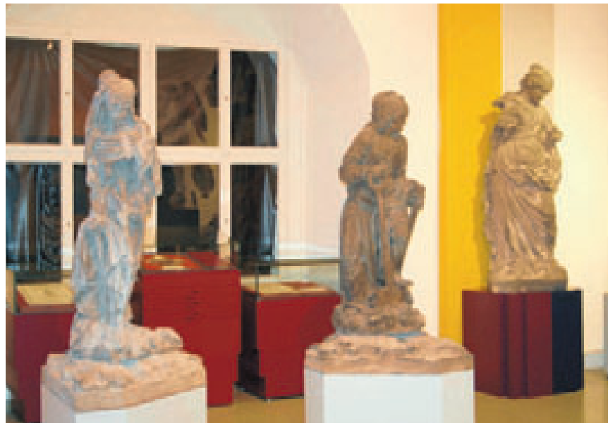
Im Skulpturensaal der Sonderschau künden Meisterwerke nicht nur der herzoglichen Merseburger Hofbildhauer von der einstigen Pracht der Residenzstadt.

Da schon bald nach dem Ende der herzoglichen Herrschaft die große kulturelle Ausstrahlung der Residenzen in Merseburg, Weißenfels und Zeitz verblasste, geriet auch das Wissen über diese Epoche lange in Vergessenheit. Das Forschungsprojekt des Museums-