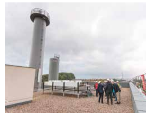
Effiziente Energieerzeugung: Das neue Blockheizkraftwerk am Leunaweg

zuletzt wegen der hohen Investitionen der vergangenen Jahre. In den nächsten Jahren werden wir deshalb die Erneuerung von älteren Anlagen angehen, um die Versorgungsbedingungen für die Kunden weiterhin stabil zu halten und da, wo es notwendig ist, noch zu verbessern.