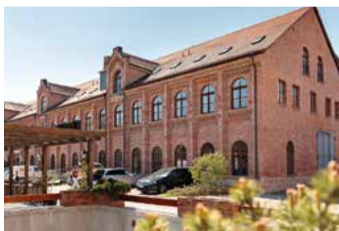
Bietet viel Platz für neue Wohnkonzepte: Der Denkmalhof in Merseburg.

Viele kennen den Merseburger Denkmalhof noch als Veranstaltungsort unter dem Namen „Kulturfabrik“. Merseburger Abiturienten feierten dort ihre Feste, Theater- und Tanzveranstaltungen fanden statt, und auch After-Work-Partys waren hier zu Hause. Jetzt wird vieles anders. Mit barrierefreien Apartments wird der Denkmalhof zur Wohnoase.