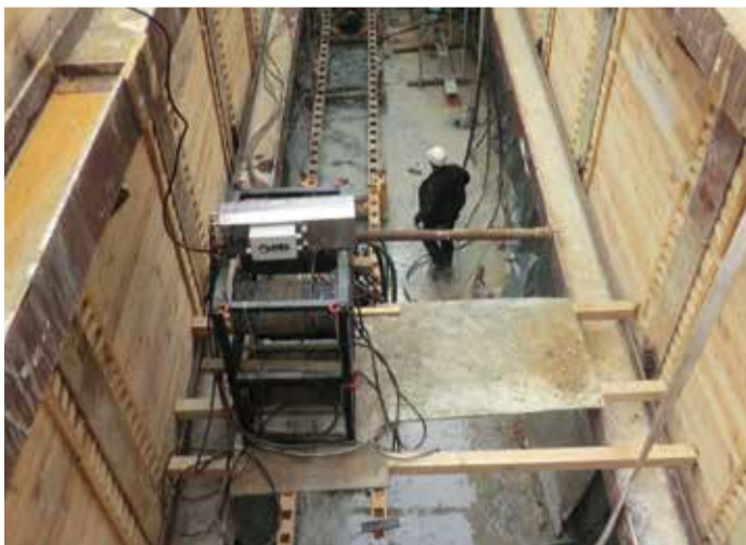
Fachleute führten mit einem Spezialbohrgerät die Arbeiten in der Startgrube aus.

Fernwärme der Stadtwerke Merseburg wird künftig noch umweltfreundlicher. Durch den geplanten Einsatz CO 2 -armer Abwärme aus der Thermischen Restabfallbehandlungs- und Energieerzeugungsanlage (TREA) in Leuna wird der Einsatz fossiler Energieträger weiter verringert und die Umwelt entlastet.