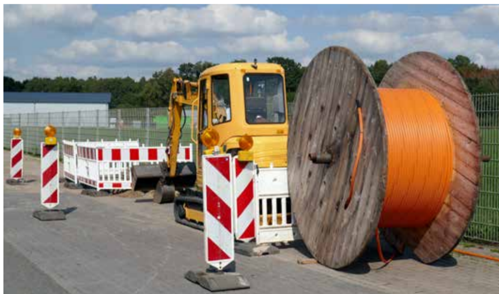
In Kürze beginnen die Bauarbeiten: Braunsbedras Ortsteil Krumpa erhält direkte Glasfaseranschlüsse für das schnelle Internet der Stadtwerke Merseburg.

www.stadtwerke-merseburg.de/ internet-telefon-glasfaser.html